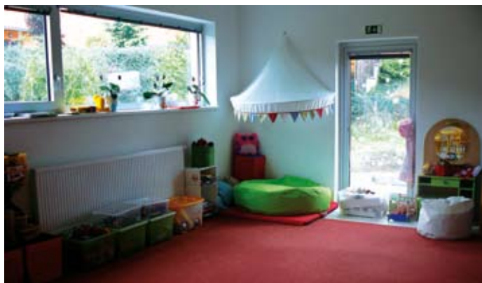
Třída v MŠ