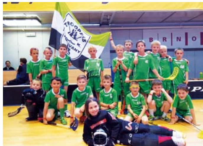
Historický úspěch hráčů přípravky na turnaji Open Game 2016