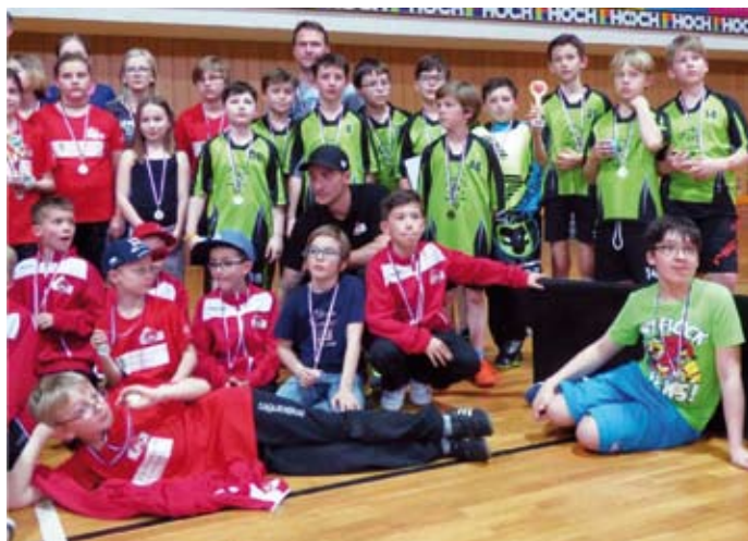
Stříbrné a bronzové družstvo elévů (v zelených dresech)