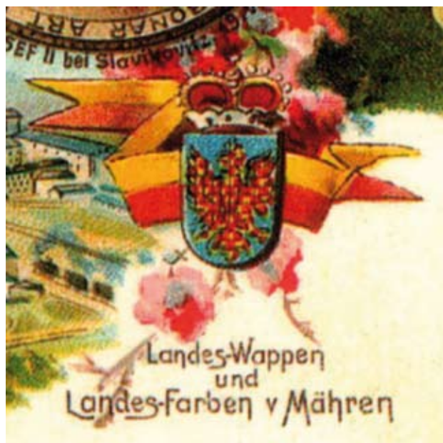
Zemské barvy a znak Moravy, 1900

Příchod patronů Moravy sv. Cyrila a Metoděje k nám na Moravu byla událost obrovského kulturního a duchovního významu nejen pro naši zem, ale pro značnou část Evropy. Na počest této události bude na naší radnici vyvěšena moravská vlajka. Moravská vlajka je v současnosti také vnímána jako symbol sounáležitosti občanů k území Moravy, jejího duchovního a společenského života.