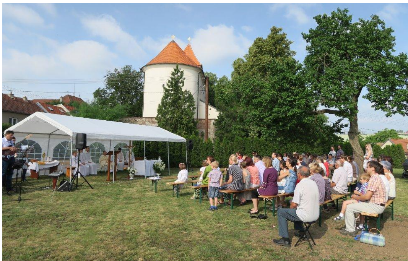
Oslavy svátku Božího Těla na farní zahradě.

Římskokatolická farnost Moravany, Vnitřní 41/13, 664 48 Moravany, tel.: 604 345 370, e-mail: moravany@dieceze.cz, www.farnostmoravany.cz