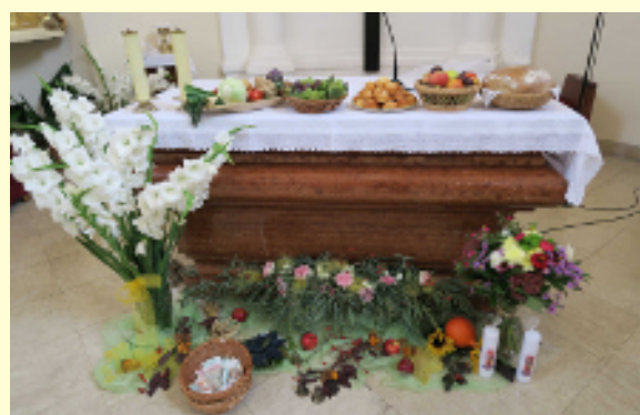
Ozdobený oltář ze slavnosti svatého Václava

Nyní bývá zobrazován jako kníže na koni nebo je vyobrazen jeho skon u dveří kostela ve Staré Boleslavi. Klepadlo ze dveří kostela, kterého se Václav držel, údajně Karel IV. dal připevnit na dveře kaple sv. Václava v katedrále sv. Víta v Praze.