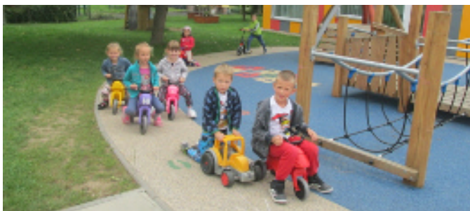
Do třídy na Pšeníku nakoukněte níže na fotografiích.

Nové detašované pracoviště v Brně na adrese Pšeník 18 nabídlo další třídu pro naše nejmenší. Na ty čekala nově vybudovaná ovečková herna a lehárna. S rozrůstáním obce máme tedy už šest tříd mateřské školy Moravany. Pět tříd běžných a jednu speciální.