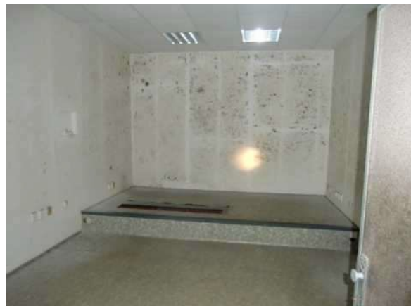
interiér obj. 03