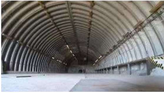
interiér obj. 03