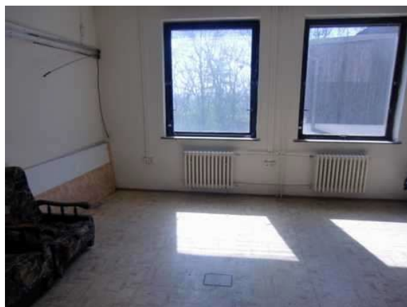
interiér obj. 04