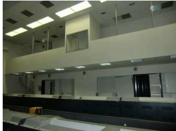
interiér obj. 03