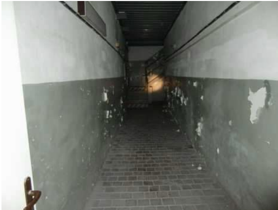
interiér obj. 03