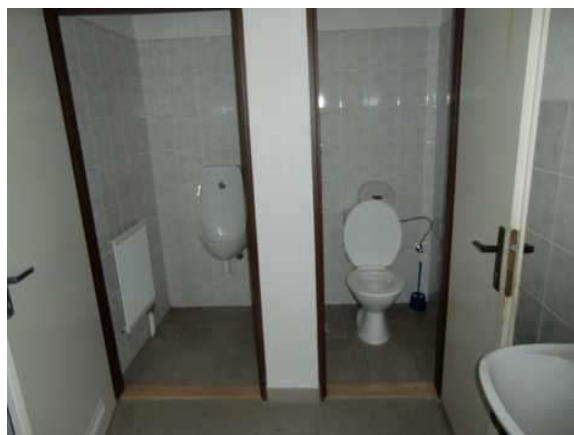
interiér obj. 04