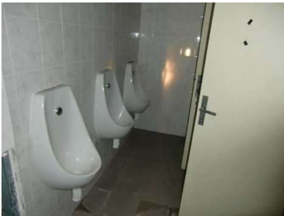
interiér obj. 03