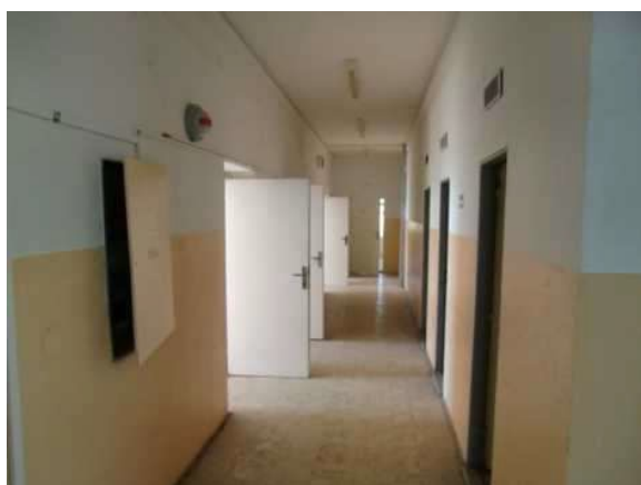
interiér obj. 04