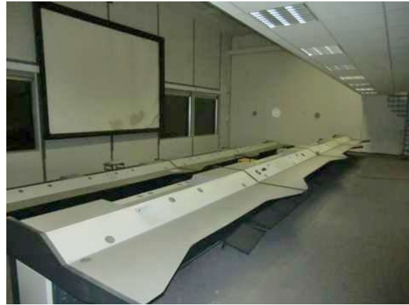
interiér obj. 03