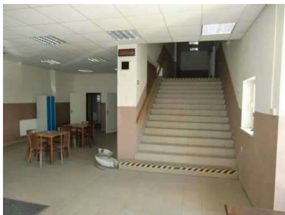
interiér obj. 04