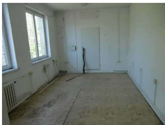
interiér obj. 04