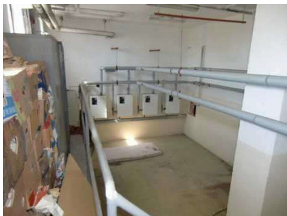
interiér obj. 04