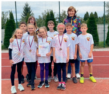
Foto 1 - Ukázka florbalu.