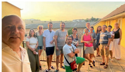
Zastupitelé na pracovní schůzce v zakoupeném areálu.

Dostali jsme dotaci od Národní sportovní agentury a zastupitelstvo odsouhlasilo její přijetí za účelem vybudování multifunkční sportovní haly, jejíž stavba bude zahájena ještě během podzimu.