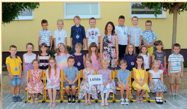
Foto 2 - Prvňáčci a jejich pátáci.